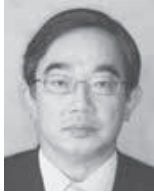
奉仕プロジェクト担当副会長